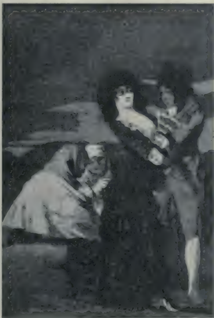
Tal para qual.

« Tous les jours, dira-t-il, quelque temps qu'il fût, je partais après mon déjeuner et après avoir entendu la messe, je chassais jusqu'à une heure et j'y revenais immédiatement